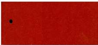
ASS ALU 3070 R