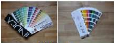
PerlColor nach NCS und RAL

Farben nach Ihrem Wunsch! Das ist unser Angebot. 3000 Farben nach RAL oder NCS Skala stehen Ihnen mit unserer Farbreihe PerlColor zur Verfügung. Hinzu kommen noch lasierende Töne und unsere farblose bis lasierende Farbreihe WoodCare. Aus unserer Farbreihe mit silanummantelten Aluminiumflacks können sie aus 13 hochqualitativen Farben wählen. Überzeugen Sie sich selbst von unserem Lieferumfang der für Ihre Individualität steht! Ihr Team der August Brühwiler AG