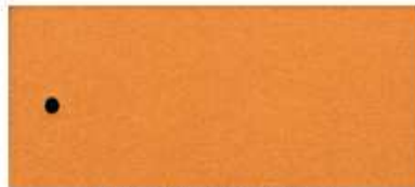
ASS ALU Kupfer