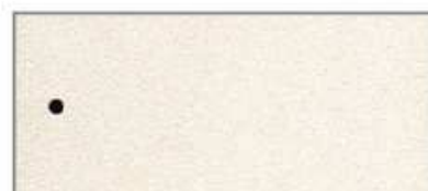
ASS ALU Silber 15/75