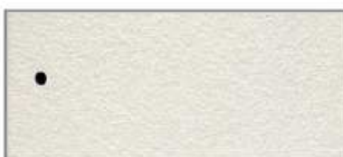
ASS ALU Silber basis