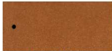
ASS ALU Braun