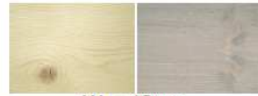
WoodCare Farblos oder Grau 635