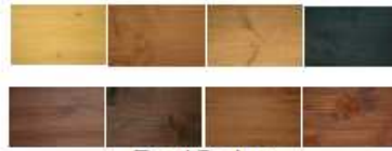
PerlColor in 10 lasierenden Tönen