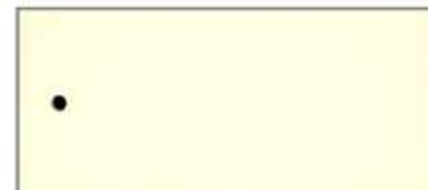
ASS ALU Gelb