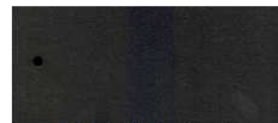
ASS ALU Anthrazit