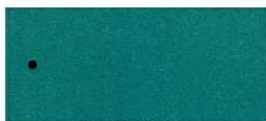
ASS ALU Grün