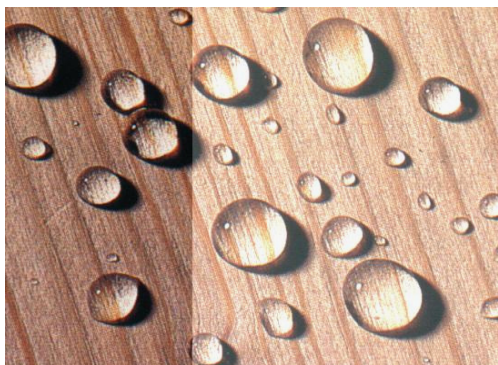
WoodCare® mit SunCare® 900