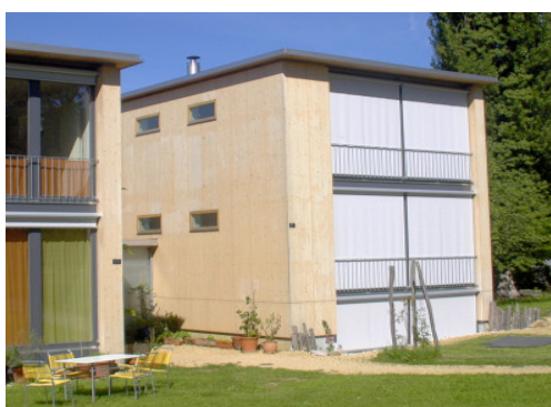
Sonnenschutz für Holzfassaden

Es ist hochaktiv für die Farbstabilisierung von naturbelassenem und farbig behandeltem Holz und erhöht die Lebensdauer von Farbanstrichen auf Holz.